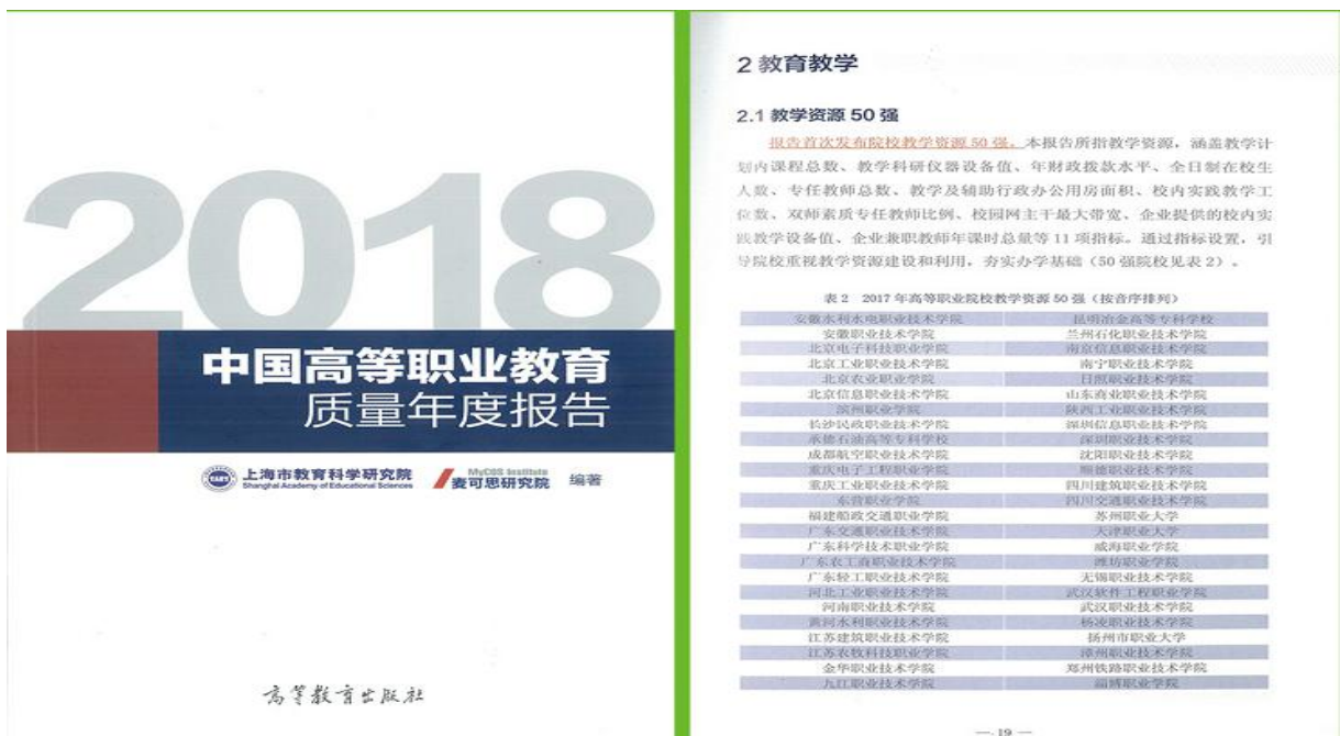
图 1 2018 高职教育年度质量报告公布 2017 年全国高职院校教学资源 50 强名单