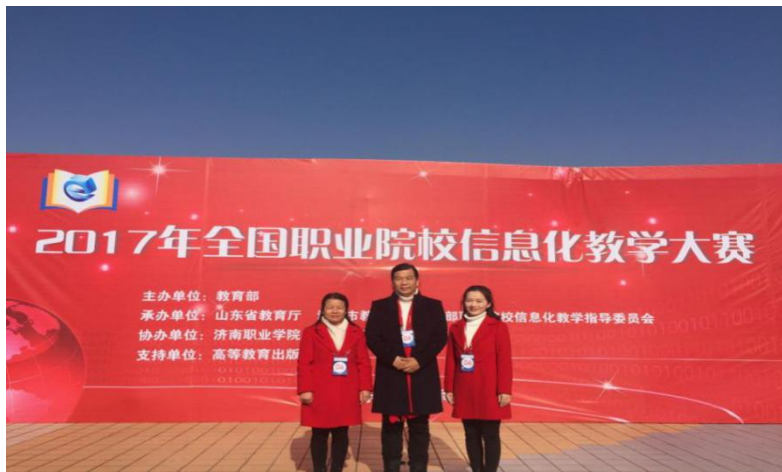
图 7 教师获 2017 年全国职业院校信息化教学大赛一等奖