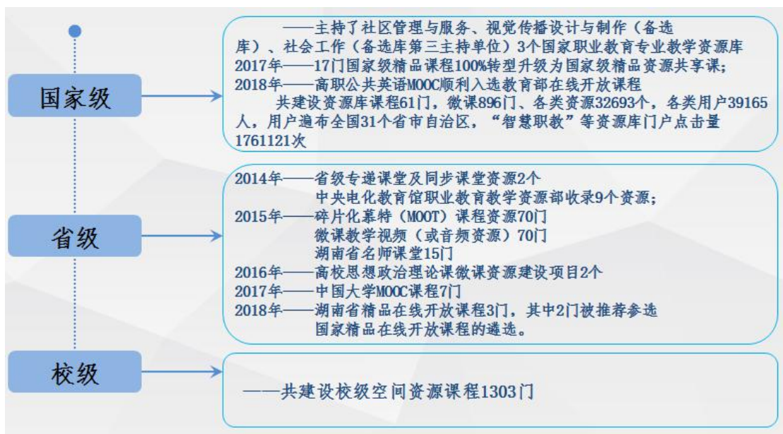
图 2 长沙民政职业技术学院三级资源体系