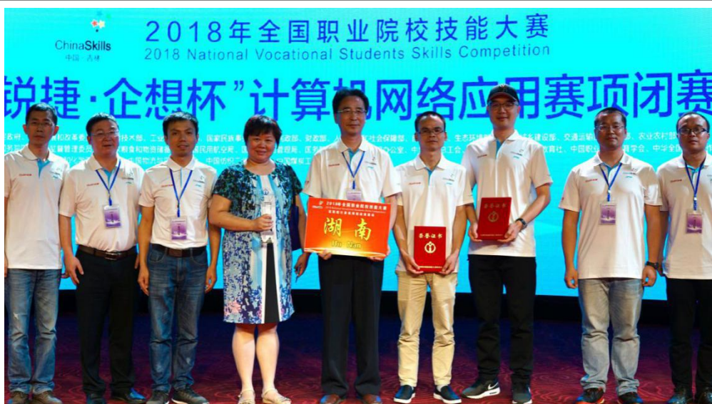
图 6 学生获 2018 年全国职业院校技能大赛计算机网络应用赛项一等奖